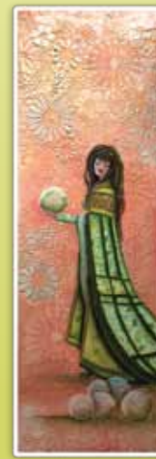
Professeure Agnès Corriveau Diplômée en Arts Plastiques