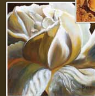
Tableaux réalisés par Monique Branconnier